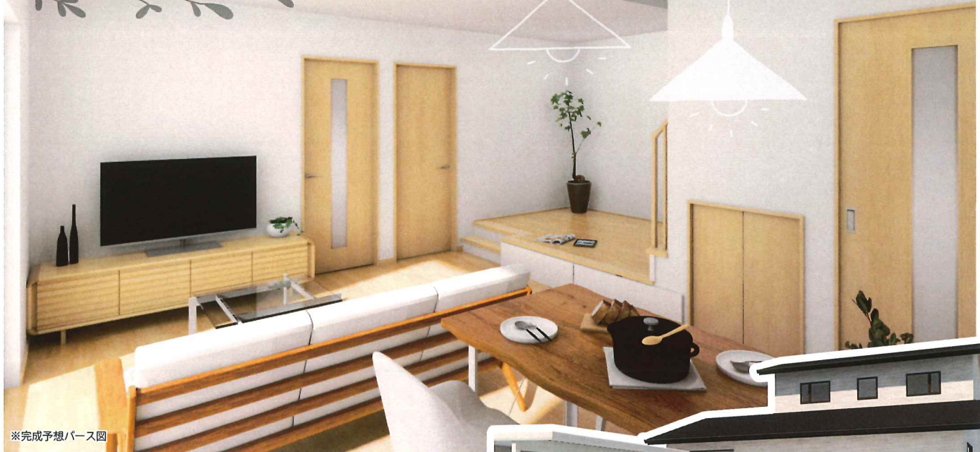
※完成予想パース図