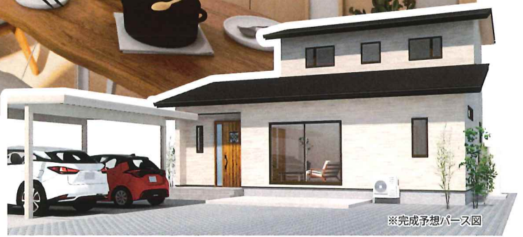
※完成予想パース図